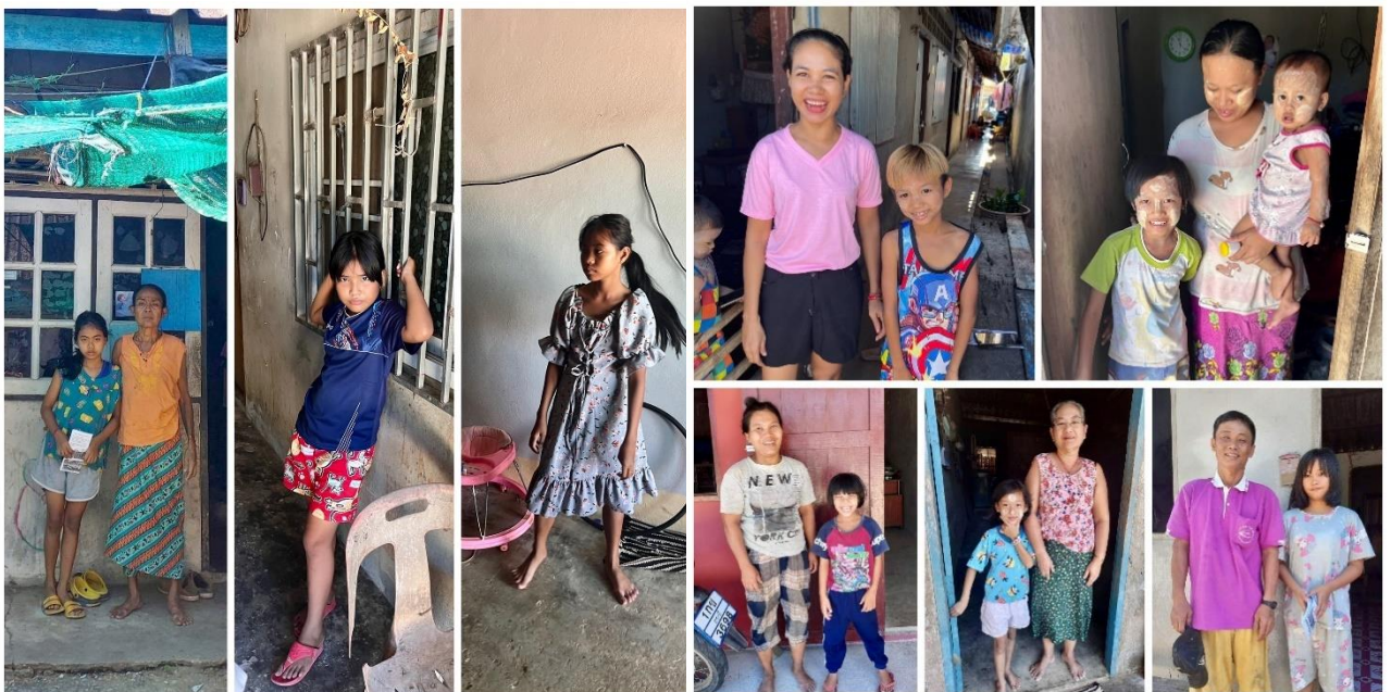
Figure 4 : Conditions de vie des étudiants

Le centre soutient les familles de migrants par l'éducation, les soins médicaux, les droits de l'homme et les programmes d'autonomisation des femmes. Notre équipe se compose de 8 enseignants (7 du Myanmar et 1 de Thaïlande) et d'un chauffeur de bus. Les élèves paient entre 200 et 500 bahts (5-12 CHF) par mois, en fonction du revenu des parents et du nombre de frères et sœurs inscrits. Près de 20 % des élèves bénéficient d'une bourse complète. Pour l'année scolaire 2022-2023, notre budget annuel de fonctionnement était de 1 121 000 bahts (27 543 CHF), avec un coût moyen de 9 700 bahts ( 238 CHF ) par élève pour une année d'enseignement