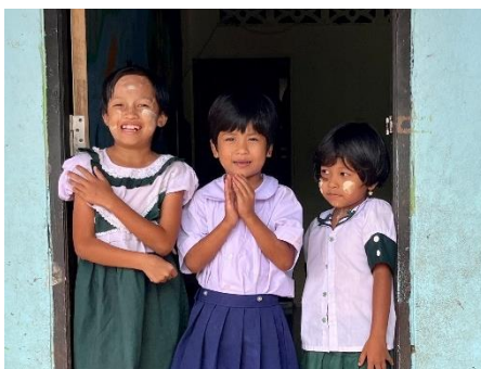
L'heure de la classe au Centre Andaman