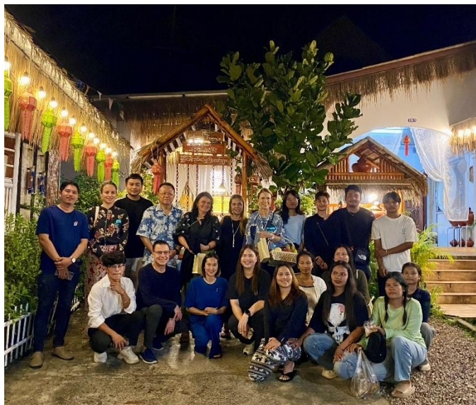
L'équipe au complet de RRAE /Ranong recycle association for environment