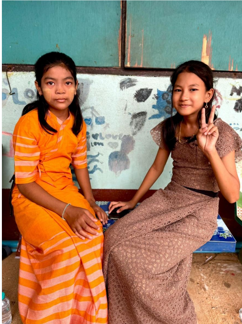
Deux jeunes élèves lors de l'inauguration du bâtiment financé par le voyage en quête de sens de Lennart Astrand.

Le bâtiment scolaire financé en 2024 grâce à la récolte de fonds effectuée par Lennart Astrand lors de son voyage en quête de sens a permis de construire un nouveau bâtiment à l'Andaman Learning Center à Kuraburi. Nous avons pu assister à l'inauguration en novembre 2025. Un complément de CHF 10'600 a été financé pour terminer les travaux de finition.