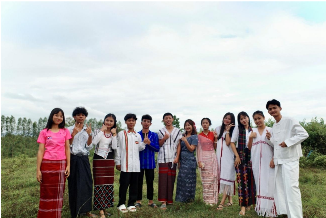
Elèves de l'école de Minmahaw